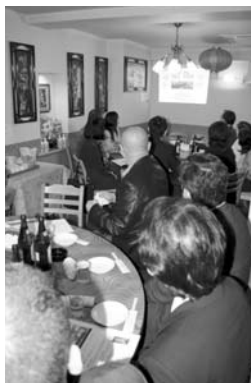
プロジェクターを使って中国のDTP事情が説明された

の産学協同プロジェクトで、DTPに関わる人材育成と即戦力化を目的とする事業を展開するなど、中国のDTP制作に深く関わっており、参加者は中国DTPの現状について知識を深めることができました。