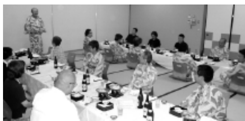
夜は和やかに懇親会を開催

毎年夏に実施される恒例の経営研修セミナーが、7月25日(金)～26日(土)に山梨県の石和温泉「ホテル やまなみ」で開催されました。今回のテーマは「編集プロダクションの周辺事業」。第1部は「編集プロの出版事業——その現状と可能性」と題して、出版事業を手がけている会員社がパネルディスカッションを行いました。第2部は「ニッチ分野を切り拓く編集プロのビジネスモデル」について講演。第3部は、新入会員社の事例報告が行われました(詳細は1ページに掲載)。その後、夜は懇親会で親睦を深め、2日目には希望者によるゴルフコンペも開催されました。