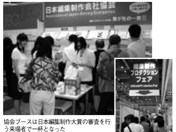
協会ブースは日本編集制作大賞の審査を行う来場者で一杯となった

◆ 企業出版部門賞 (株)エフピーアイ・コミュニケーションズ 「東京変貌～航空写真に見るこの五〇年の東京～」(幻冬舎メディアコンサルティング刊)