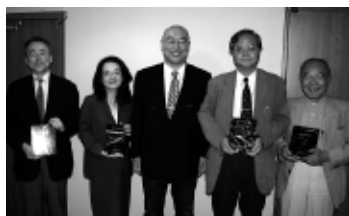
第3回「日本編集制作大賞」の授賞式の模様