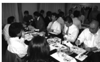
講師を交えて活発な議論を繰り広げる