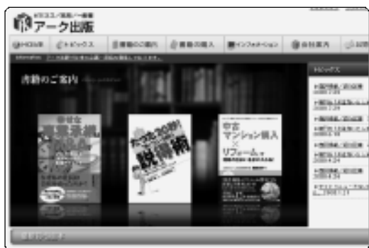
最新刊・注目を紹介している(株)アーク出版のホームページ