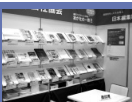
協会ブースで展示された「我が社の一冊」