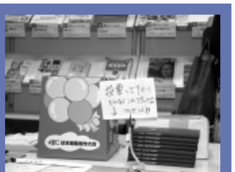
優れた作品を選んでもらう日本編集制作大賞を実施