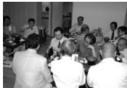
配布されたレジュメを手に議論を交わす参加者たち

なお、当日は部会開始前に、「日本編集制作大賞」の授賞式が行われ、受賞各社に楯と副賞が贈られました。