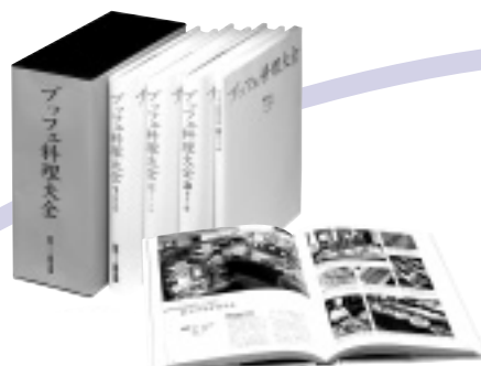
「ブッフェ料理大全」