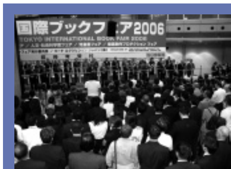
東京国際ブックフェアでのテープカットの様相

(株)アルク出版企画、(株)エディット、(株)カルチャー・プロ、(株)シンクハウス、(株)タカオ・アソシエイツ、(有)トゥーワン・エディターズ、(株)日経スタッフ、(株)パルス・クリエイティブ・ハウス、(株)群企画、(有)木香舎（音順）。