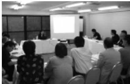
外部講師による講義を熱心に聞く参加者

は、会員社2社の業務内容を通して事例研究を実施。その後、夜は懇親会で親睦を深め、2日目には希望者によるゴルフコンペが開催されました。