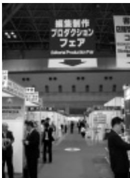
編集制作プロダクションフェアの会場に設置された協会ブース(写真右)

トリーした「我が社の一冊」を協会の特設ブース内に展示。さらに今年は、この展示物の中から優れた作品を来場者を選んでもらう「日本編集制作大賞」を開催し、協会ならびに会員社の積極的なPRの場としました。(1ページ参照)