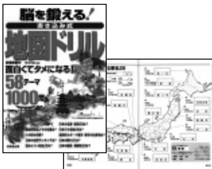
「脳を鍛える！書き込み式 地図ドリル」