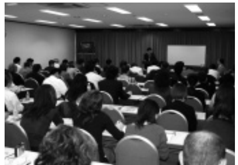
100名近くが参加した昨年の拡大編集セミナーの様相