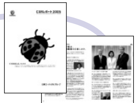
「日興コーディアルグループCSRレポート2005」