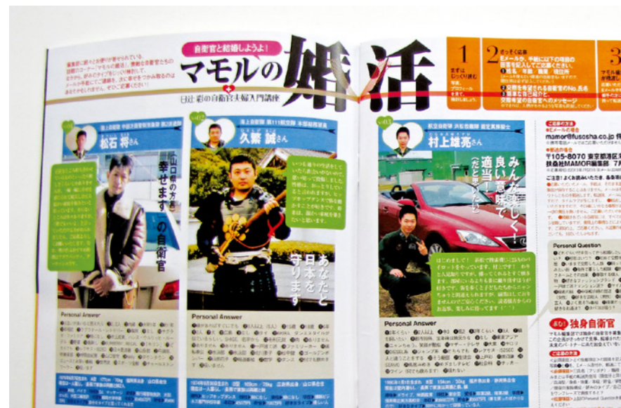
自衛官の魅力を読者に伝えるための発想力

目線から離れてしまう。だから、時々立ち止まって離れてみる。男女の関係で言うと、あんまりのめり込んじゃうと相手が見えなくなっちゃうじゃないですか。編集者はどんな人でも好きのところを見つけて相手に惚れ抜かないといけないんだけど、それだけではダメで、惚れ抜くだけだと客観的に冷静に見る視点も必要。これは雑誌の編集だけじゃなくて、クリエイティブな世界はすべて同じじゃないかな。特にカスタム出版の場合は、客観的に見る視点が大事だよ。自分の好きな部分も引かなきゃいけないかもしれないし、時には相手に引かせなきゃいけないこともある。そういう意味では大人の恋愛に近いかな(笑)。