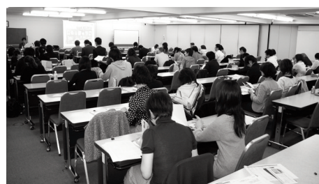
編集技術講座の受講風景

※第8回、9回はグループを組み、実際に会議・プレゼンを行います。 ※最終講義(第9回)の後に修了式&懇親会を開きます。(参加無料)